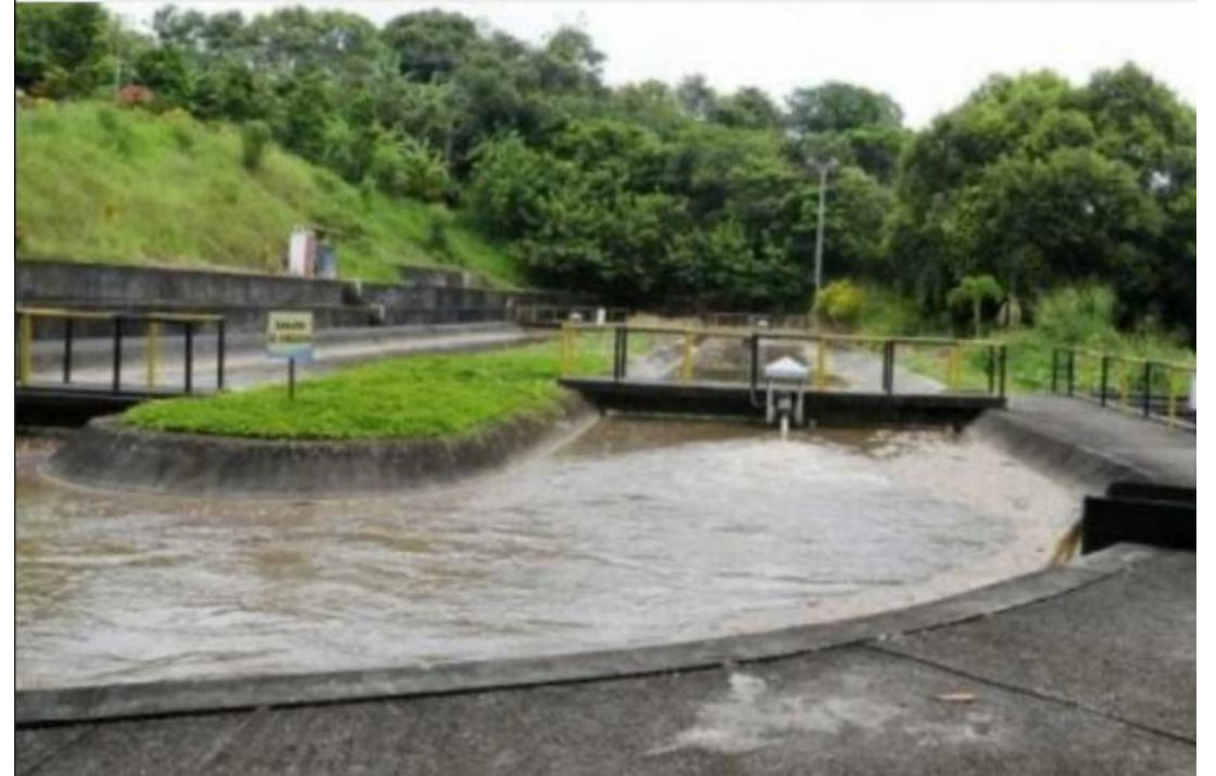
Planta de Aguas Residuales de Victoria

La Empresa de Obras Sanitarias de Caldas “EMPOCALDAS S.A E.S.P” es una Sociedad Anónima Comercial de Nacionalidad Colombiana, del orden Departamental, clasificada como empresa de servicios públicos, con autonomía administrativa, patrimonial y presupuestal, que se rige por lo dispuesto en la Ley 142 de 1994 y la Ley 689 de 2001.